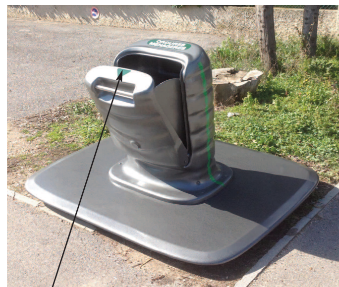
Ouverture manuelle avec fermeture automatique.

Opercule caoutchouc pour verre, existe également en clapé pour sélectif emballage ménagé, ou papier.