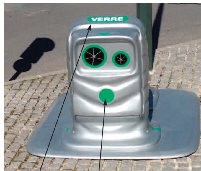
Emplacements réservés pour signalétiques