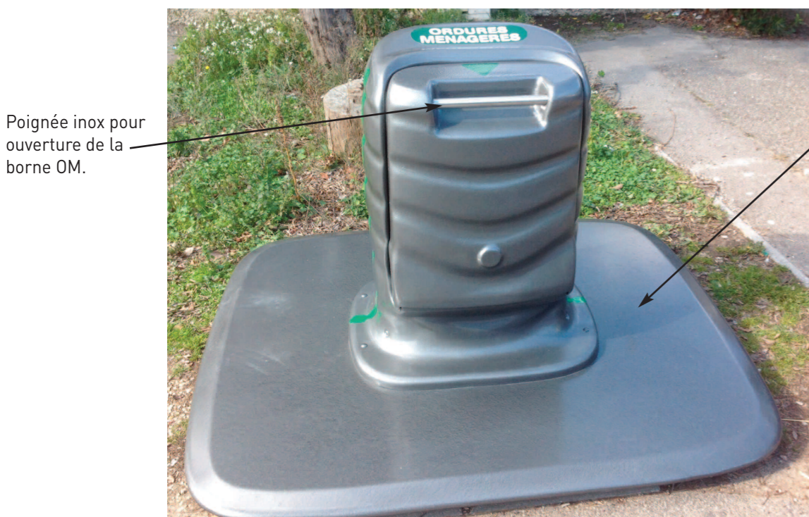
Poignée inox pour ouverture de la borne OM.